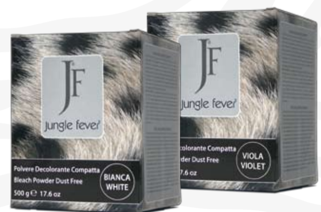
Polvere Decolorante Compatta Bleach Powder Dust Free