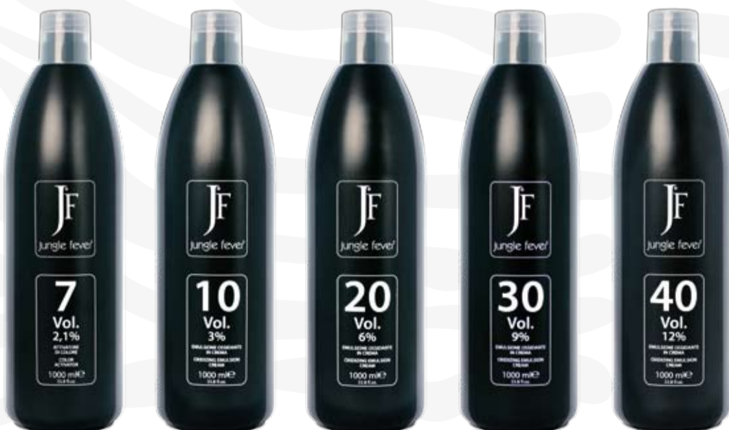
Emulsione Ossidante in Crema Oxidizing Emulsion Cream

Clean a small patch of skin behind the ear and in the fold of the elbow with surgical spirits. Use a cotton ball to apply a small amount of colouring cream, one shade or several combined shades, mixed with the Oxidizing Emulsion Cream. Allow to dry and do not wash the area for 48 hours. If any redness, swelling or itching occurs, avoid using the product.